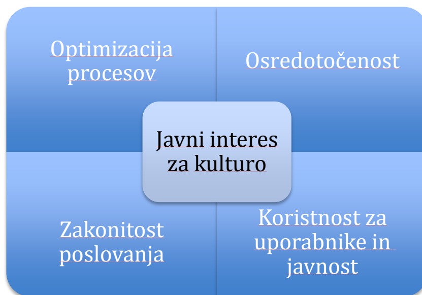
Slika 1 - Način uresničevanja poslanstva SFC