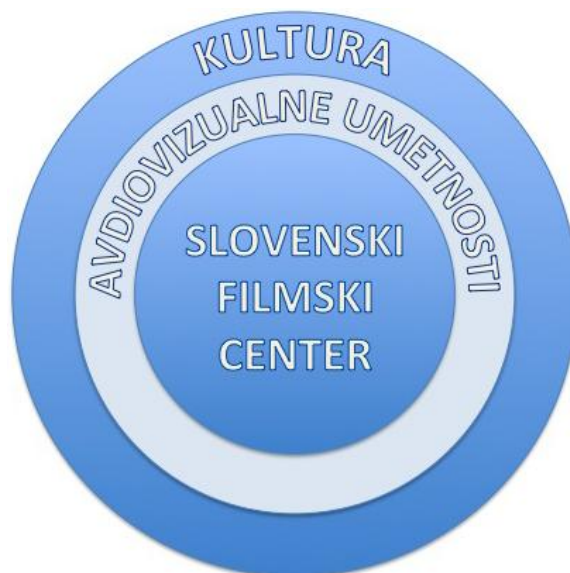
Slika 2 - Umestitev SFC v širši kontekst

Avdiovizualne umetnosti so ena od izraznih oblik široke palete pojavnih oblik kulturnega in umetniškega ustvarjanja. Film je format, ki lahko združuje prav vse